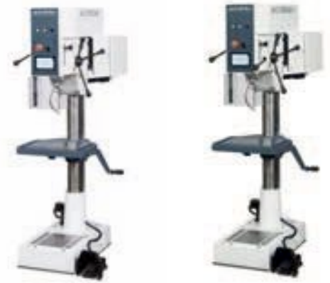
Abb. mit Optionen